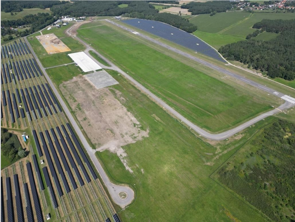
Gewerbeflächen mit Blick aus Süden nach Norden