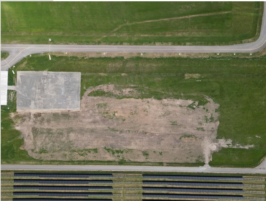
Gewerbefläche ca 3,5 ha südlich der Tankstelle