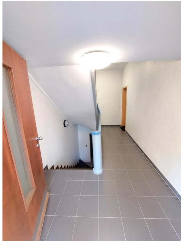
Hausflur - Eingangsbereich